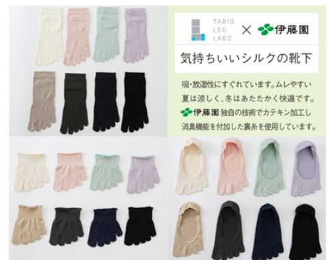
※製品ラインアップイメージ