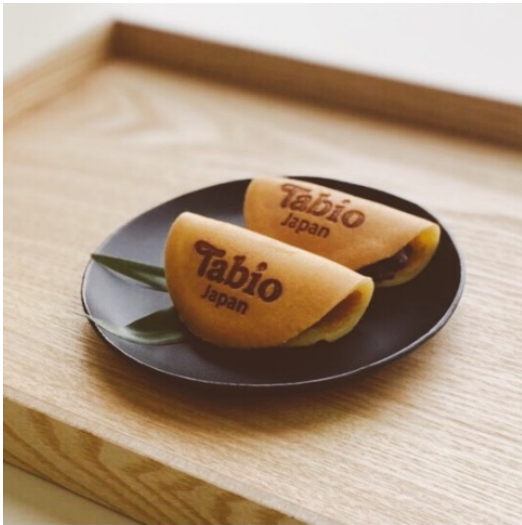
オリジナル焼印入りどら焼き

またオープン時には、税込 3,000 円以上お買い上げのお客様に「木挽町よしや」のオリジナル焼印入りどら焼きをプレゼントします（なくなり次第終了）。