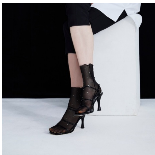
縫製チュール×ラインストーンクルー

Tabio ブランド旗艦店限定商品として、ラインストーンをあしらった、縫製チュール×ラインストーンクルー（税込 4,400 円）や、素材切り替えのエッジの効いた高級感のある、縫製フェイクレザー×チュールクルー（税込 2,970 円）を先行販売します。