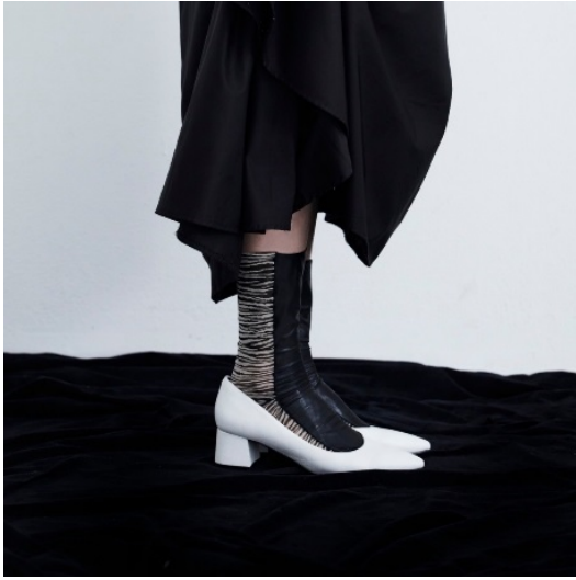
縫製フェイクレザー×チュールクルー

またオープン時には、税込 3,000 円以上お買い上げのお客様に「木挽町よしや」のオリジナル焼印入りどら焼きをプレゼントします（なくなり次第終了）。