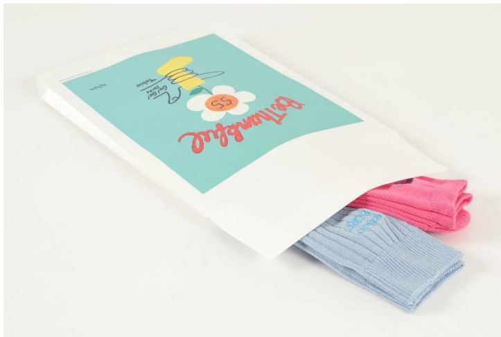
(通販配送パッケージイメージ)

* 2023年5月5日出荷分から、キャンペーンビジュアルを通販パッケージに採用します