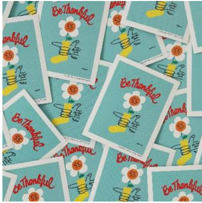
(ステッカーデザインのイメージ)